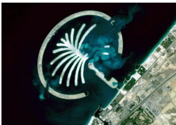
Satellietopname van Palm Island, Dubai

BHD en Van Oord worden samengevoegd tot één onderneming, die zal opereren onder de naam Van Oord NV. De nieuwe gecombineerde onderneming zal op de baggermarkt een sterke positie innemen. De omvang en samenstelling van de gezamenlijke vloot, de positie op de markt voor offshore-activiteiten en kustwaterbouw, alsmede de wereldwijde aanwezigheid staan hier borg voor. Beide ondernemingen werken in joint-venture verband samen, onder meer op de omvangrijke landaanwinningsprojecten in Singapore en de projecten in Dubai (Palm Island, World Island, Deira Corniche).